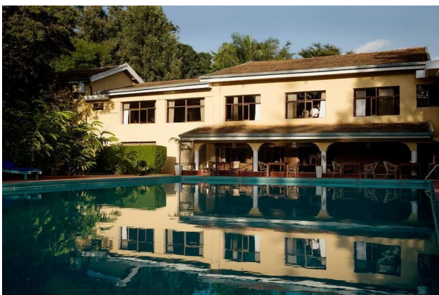
Zanzibar, Stone Town: Tembo House Hotel, pokoje 2-os. z łazienką lub Mizingani Seafrent Hotel