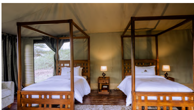
Ngorongoro: Embalakai Camp, namioty 2-os. z łazienką