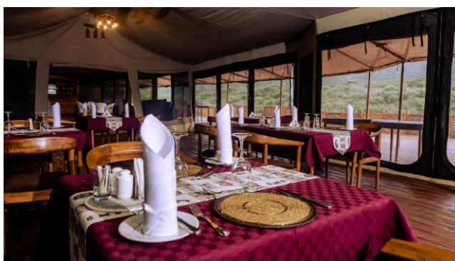
Arusza: Ilboru Safari Lodge, pokoje 2-os. z łazienką